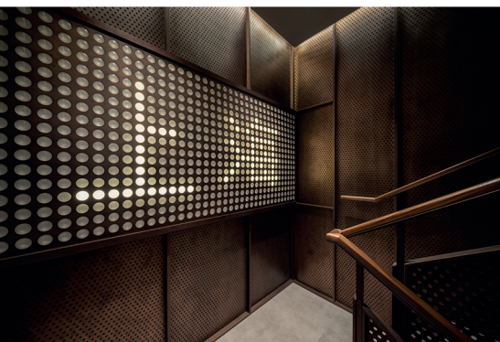
4. 수직 프레임과 금속 다공판이 줄지어 있는 '암실'은 방문객들의 층간 이동 경험을 극대화하는 원형 시설이다. 설계팀은 산업용 자재들로 계단을 디자인했다. 계단 입구 벽면은 629개의 광학렌즈로 구성됐다. 5. 3층은 이용자들이 서로 교류하는 공간이다. 천장에는 수많은 조명을 매달아 빛이 쏟아지는 그 하늘 아래에서 캠핑하던 추억을 소환했다.